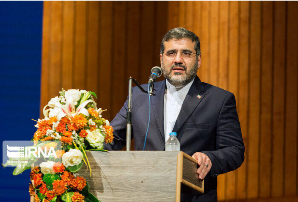
را خیلی کاهش دادیم.

وی افزود: کشور ما باید به صادرکننده کاغذ تبدیل شود و با تامین کاغذ بازار کشورهای منطقه به درآمدزایی در این حوزه برسیم. از همه اهالی نشر و اصحاب مطبوعات نیز دعوت می کنم استفاده از کاغذ ایرانی را در دستور کار قرار دهند. تولیدکنندگان هم قول می دهند که کیفیت کاغذ داخلی همواره رو به افزایش و در جهت جلب رضایت ناشران و مخاطبان پیش بروند.