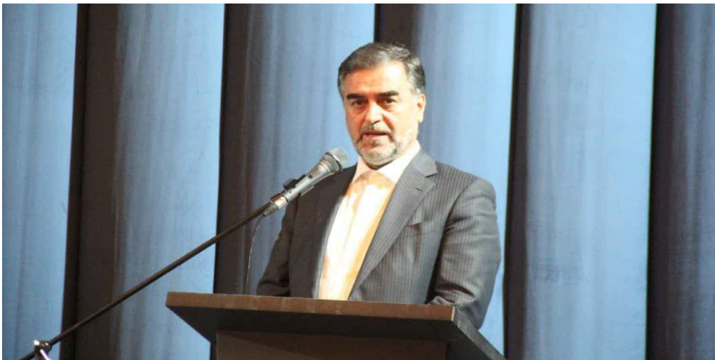
پرافتخار این استان است.

استاندار مازندران با اشاره به عقد قرارداد با قرارگاه خاتم الانبیا برای سرمایه گذاری اجرای طرح های راهسازی استان عنوان داشت: این طرح ها با اعتبار سه هزار میلیارد تومانی توسط این قرارگاه اجرا می شود.